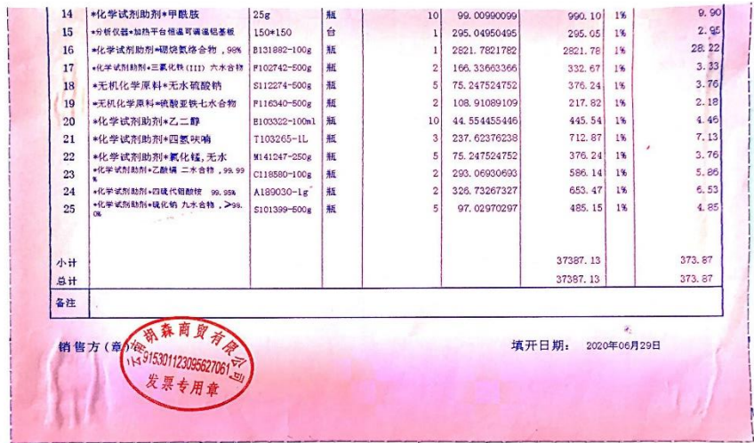
图 5 税控清单粘贴图样