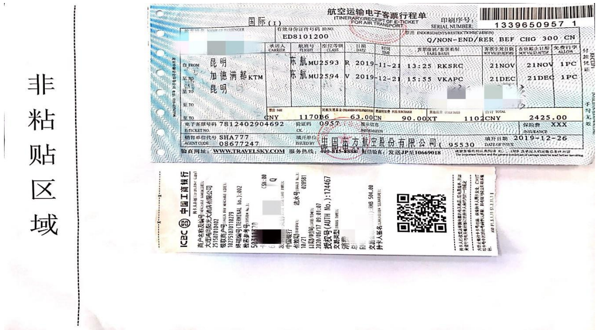
图 2 机票粘贴图样

2. 若有 POS 刷卡小票，应与机票粘贴在同一张粘贴单上；若多张机票对应一张 POS 小票，应将 POS 小票粘贴在第一张机票的粘贴单上。