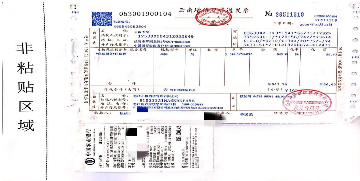
图 4 增值税发票粘贴图样

2. 若发票对应有税控清单，且清单较大无法粘贴在同一张粘贴单上，则分页粘贴，但须将粘贴好的清单附于该张发票后，以便审核；若税控清单为 A4 纸，则不用粘贴，附于该张发票后即可。税控清单粘贴示例如下：