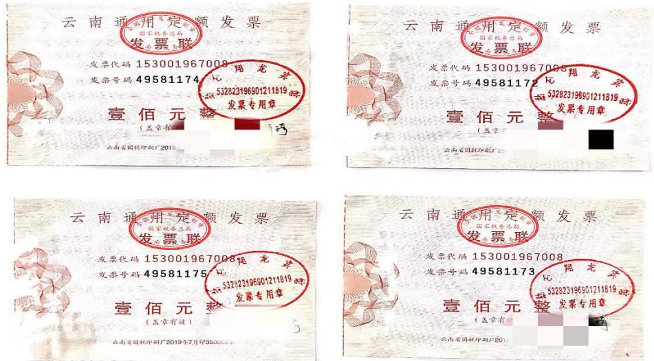
图 6 手撕发票粘贴图样