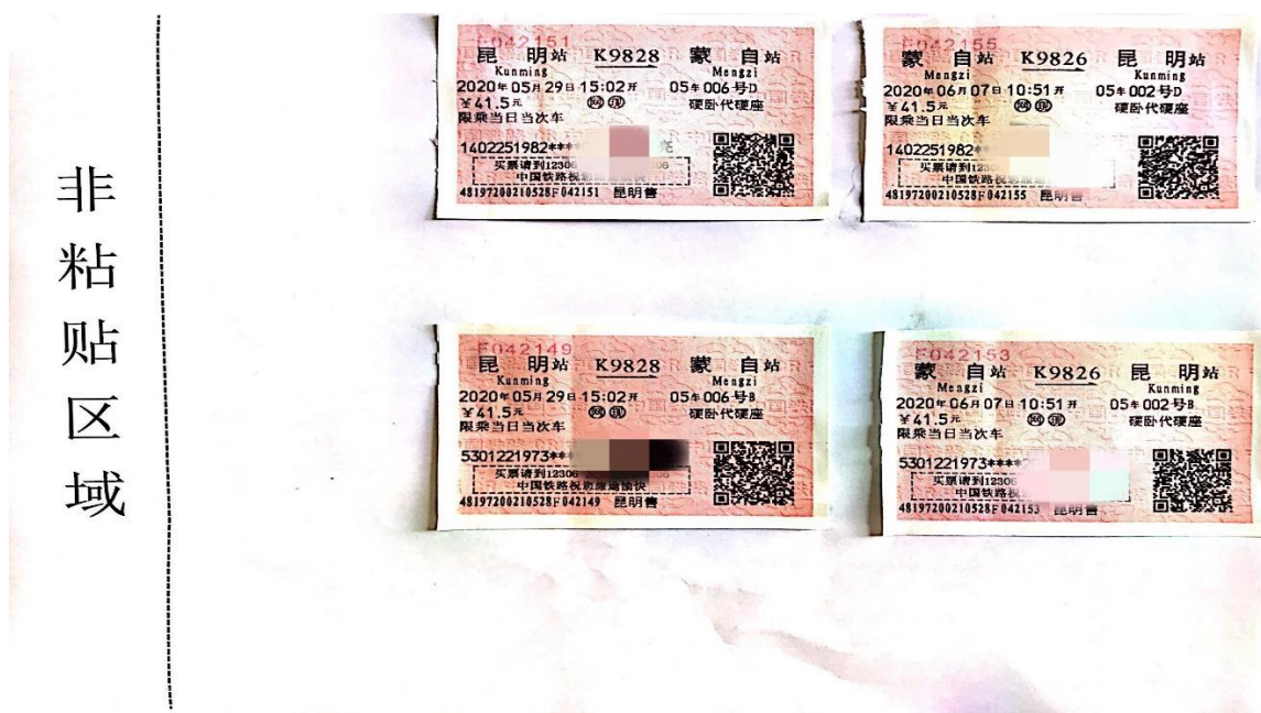
图 3 火车票粘贴图样